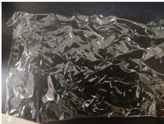
图 2. 鼓风干燥后从玻璃平板上揭下的保鲜膜