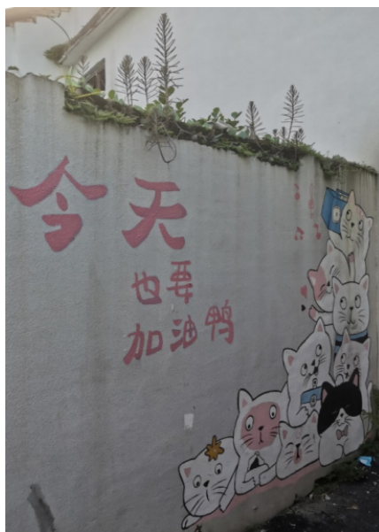
图3 永汉镇街区的豹猫“汉宝”壁画（“嬉戏猫群”）

永汉镇圩的“寻猫之旅”项目，不仅激活了增龙路商业生态，而且推动了“永汉生活”小城市品牌的体系化建设 ② ，“环南昆山-罗浮山”最美旅游公路建设也促使公路沿线民房造型融入了岭南传统杉木屋元素，形成了“IP 驱动空间重塑—场景激活流量—产业反哺社区”的乡村振兴新范式。例如，在闲置空间的改造中，