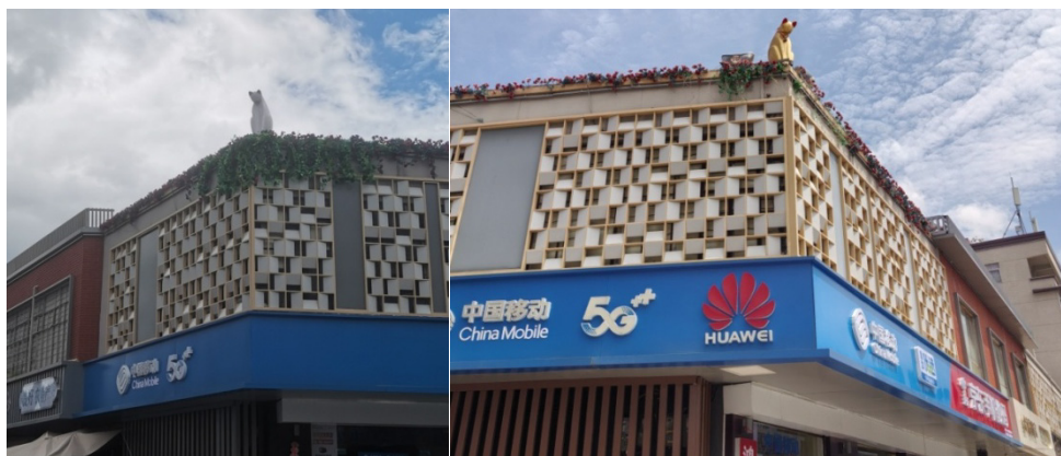
图6 永汉镇圩的豹猫“汉宝雕塑”（中国移动猫）前后改造

注：左图为笔者2024年7月田野调查时所摄，当时的浮雕配合灯光，栩栩如生；右图为笔者2025年9月田野调查时所摄，已被迁至另一个地方，新处所的房屋外立面长满藤蔓，原有的灯光效果也荡然无存。经访谈询问周围商户，得知，浮雕原来所在的地方，房屋外立面进行翻新，被迫拆除，置于现在的地方。