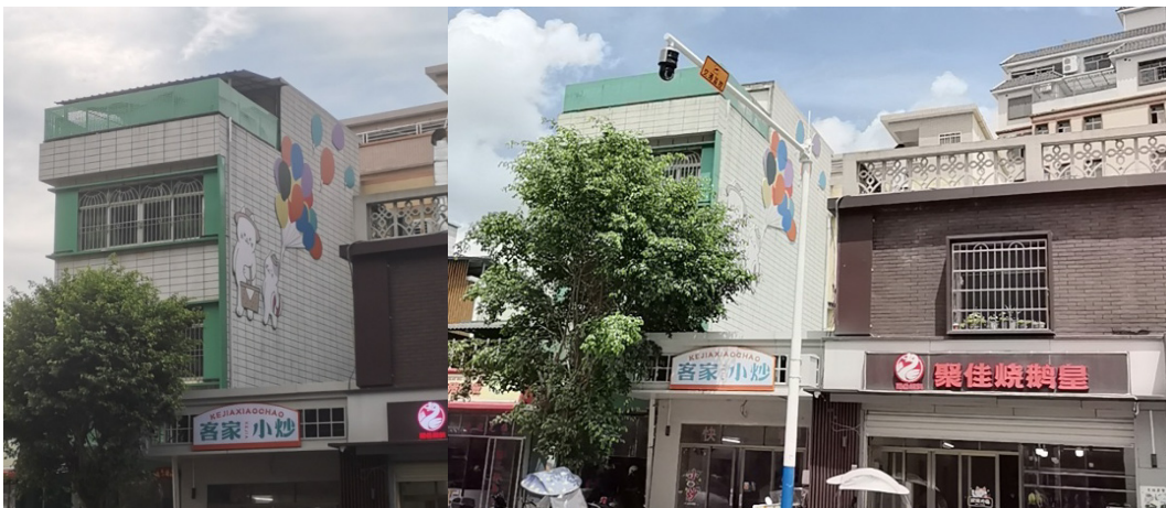
图 4 永汉镇圩的这处壁画，因加装交通设施影响观赏

在《传统的发明》一书中，历史学家埃瑞克·霍布斯鲍姆(Eric Hobsbawm)指出：“‘被发明的传统’意味着一系列实践，通常受制于明示或默示的规则，并具有仪式性或象征性；它们试图通过重复来灌输特定的价值观和行为规范，从而自动暗示与过去的连续性” [1] 。本研究中永汉镇圩以“寻猫之旅”项目为代表的南昆豹猫文化的传播实践，正是此类“发明的传统”的典型诠释。