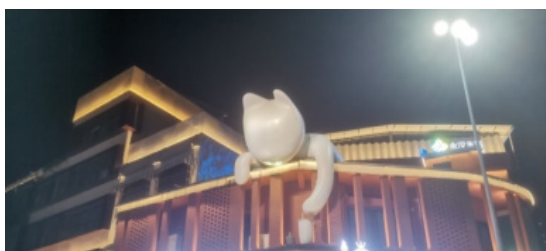
图1 永汉镇街区的豹猫“汉宝”雕塑（“抓杯猫”）