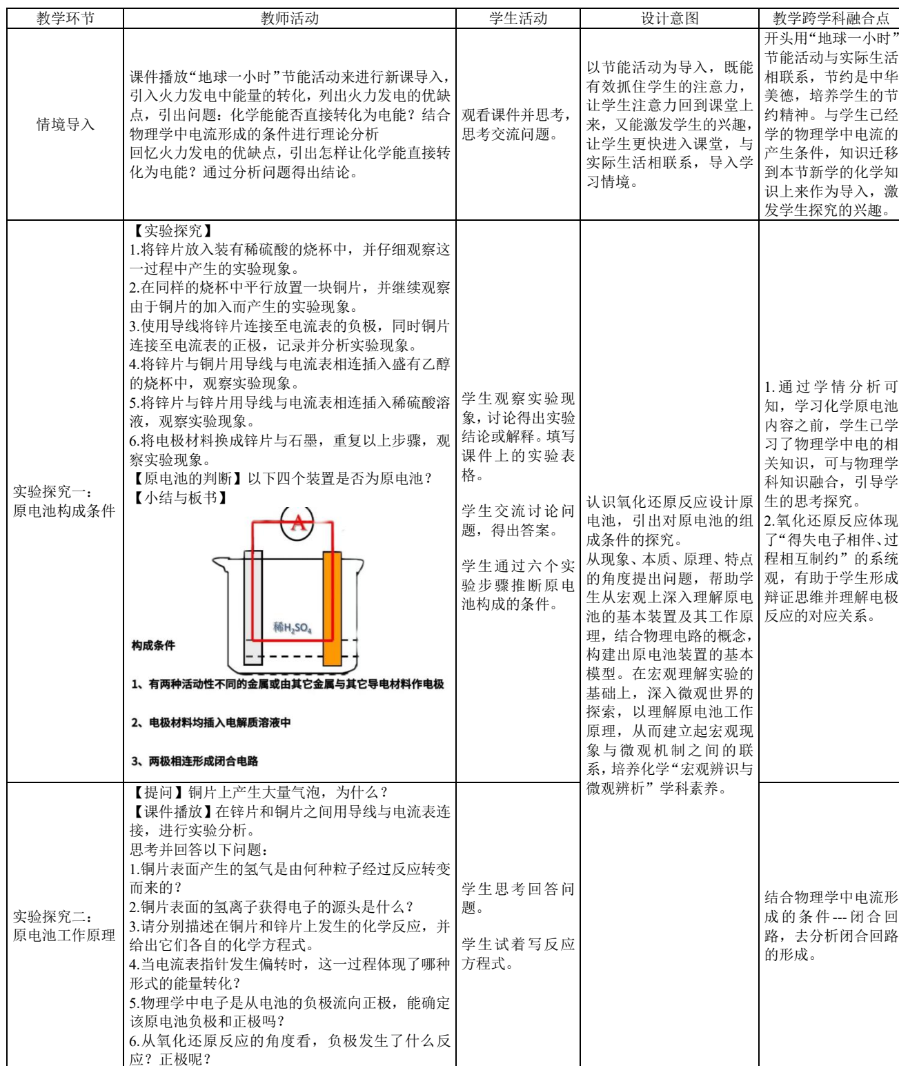
表1 “原电池”教学过程