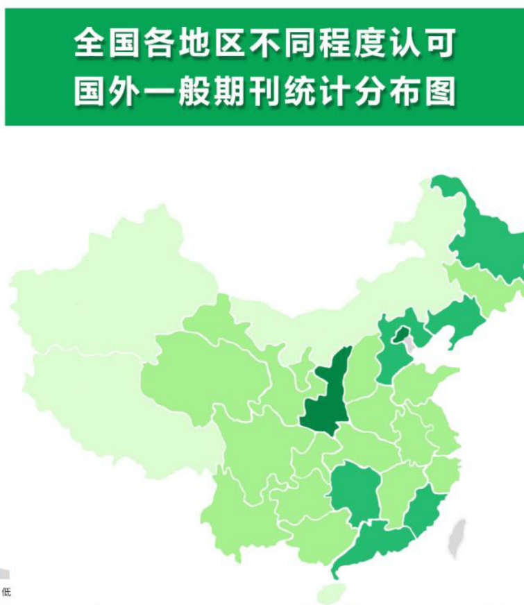
图 7 全国各地区不同程度认可国外一般期刊统计分布图

中国地区学者在国外一般核心期刊发表论文被认可度比较高, 国外期刊制度灵活, 信息化程度较高, 尤其是发达国家的期刊, 对因国内期刊数量不足, 发表排队和发表周期过长的问题, 起到了一定程度的缓解作用, 学者可以根据所在部委系统、省市单位的具体政策来具体选择合适的国外期刊, 快速获得首发权, 以保护自己的研究成果, 并与国际同行进行学术交流。